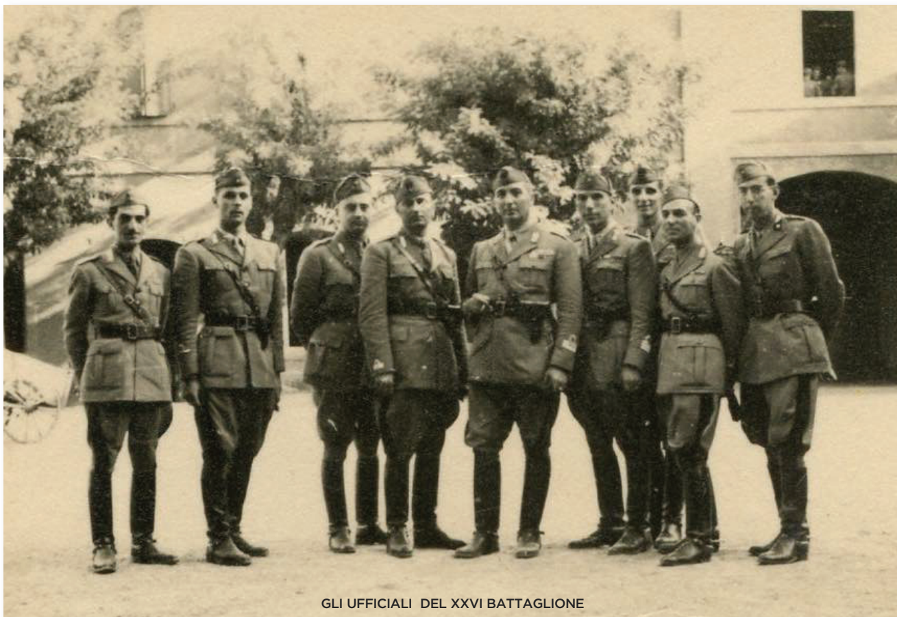
GLI UFFICIALI DEL XXVI BATTAGLIONE