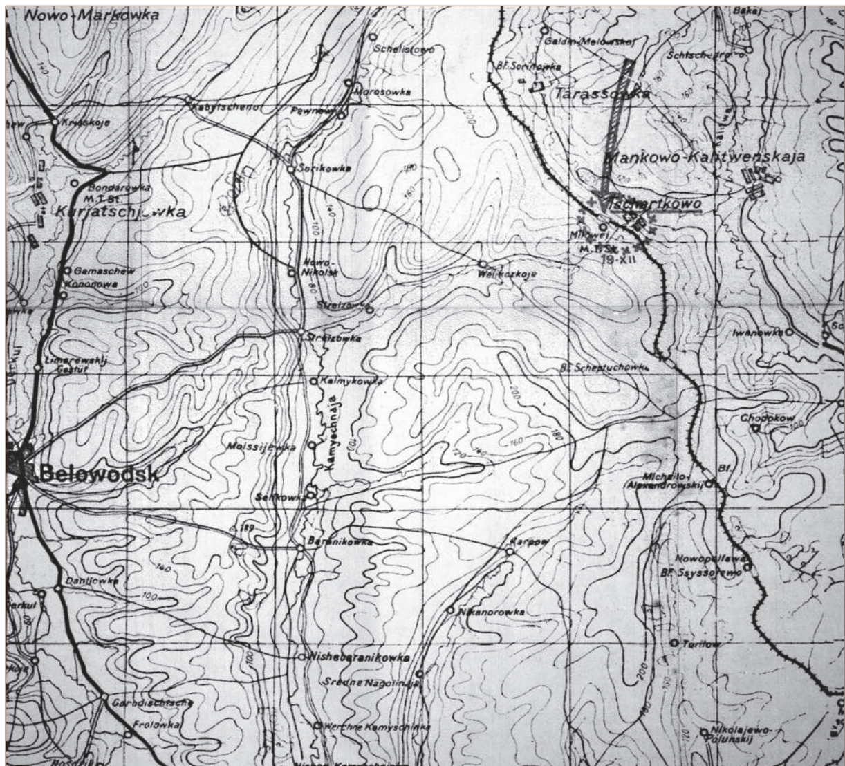
CARTINA MILITARE DELL'EPOCA

primo pomeriggio del 14 Buffa, durante una ricognizione, viene attaccato da una decina di russi che sparano con i parabellum da una casa.