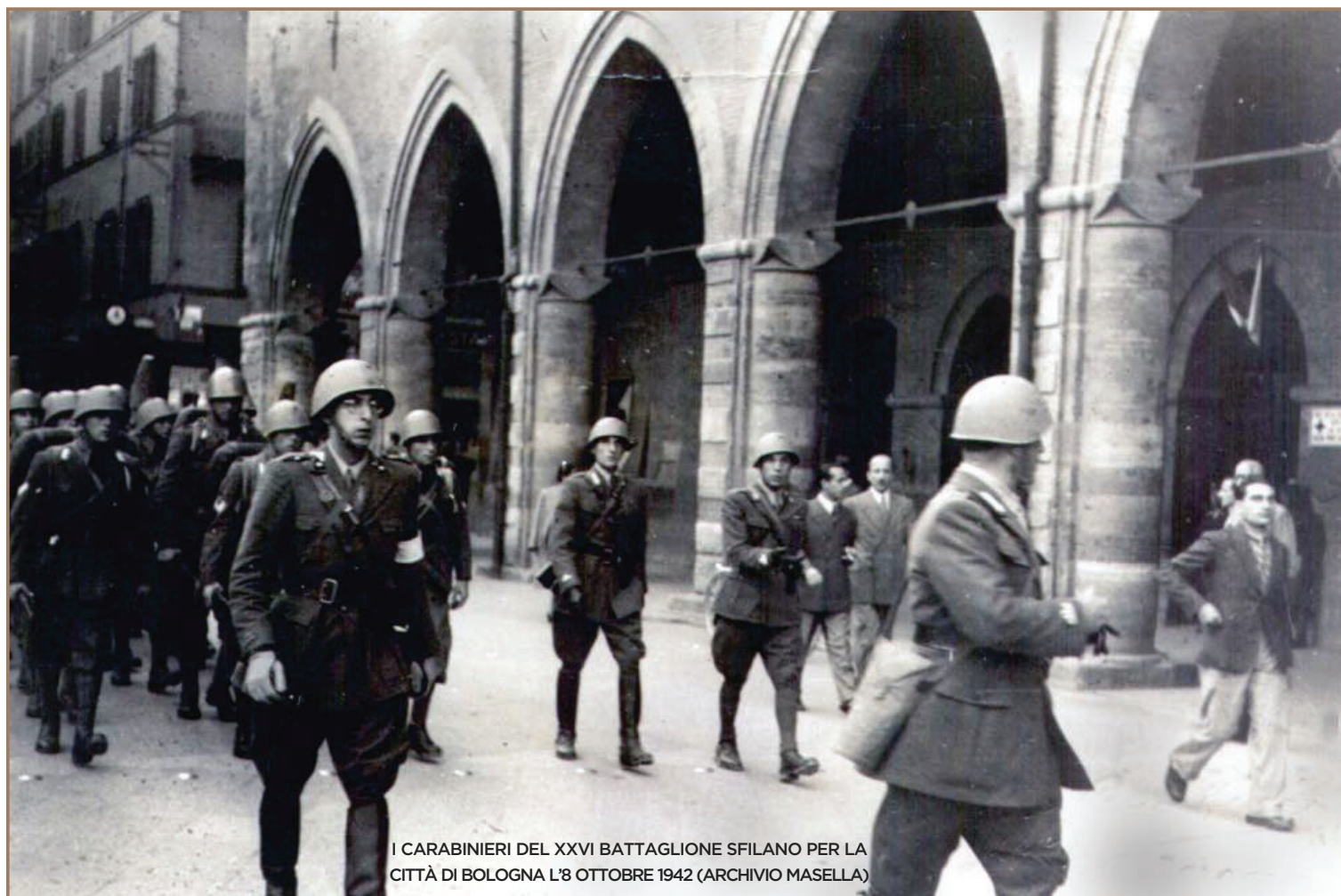
I CARABINIERI DEL XXVI BATTAGLIONE SFILANO PER LA CITTÀ DI BOLOGNA L'8 OTTOBRE 1942